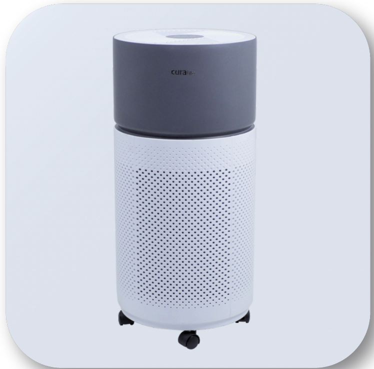
ตั้งพื้น / เคลื่อนที่