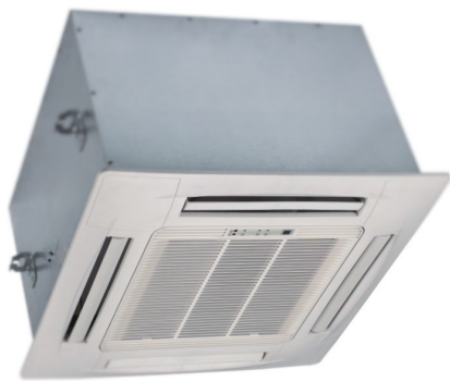
CRA350 Filtration Efficiency

Room Volume: 30 cu.m . Particle Size: 0.3 micron